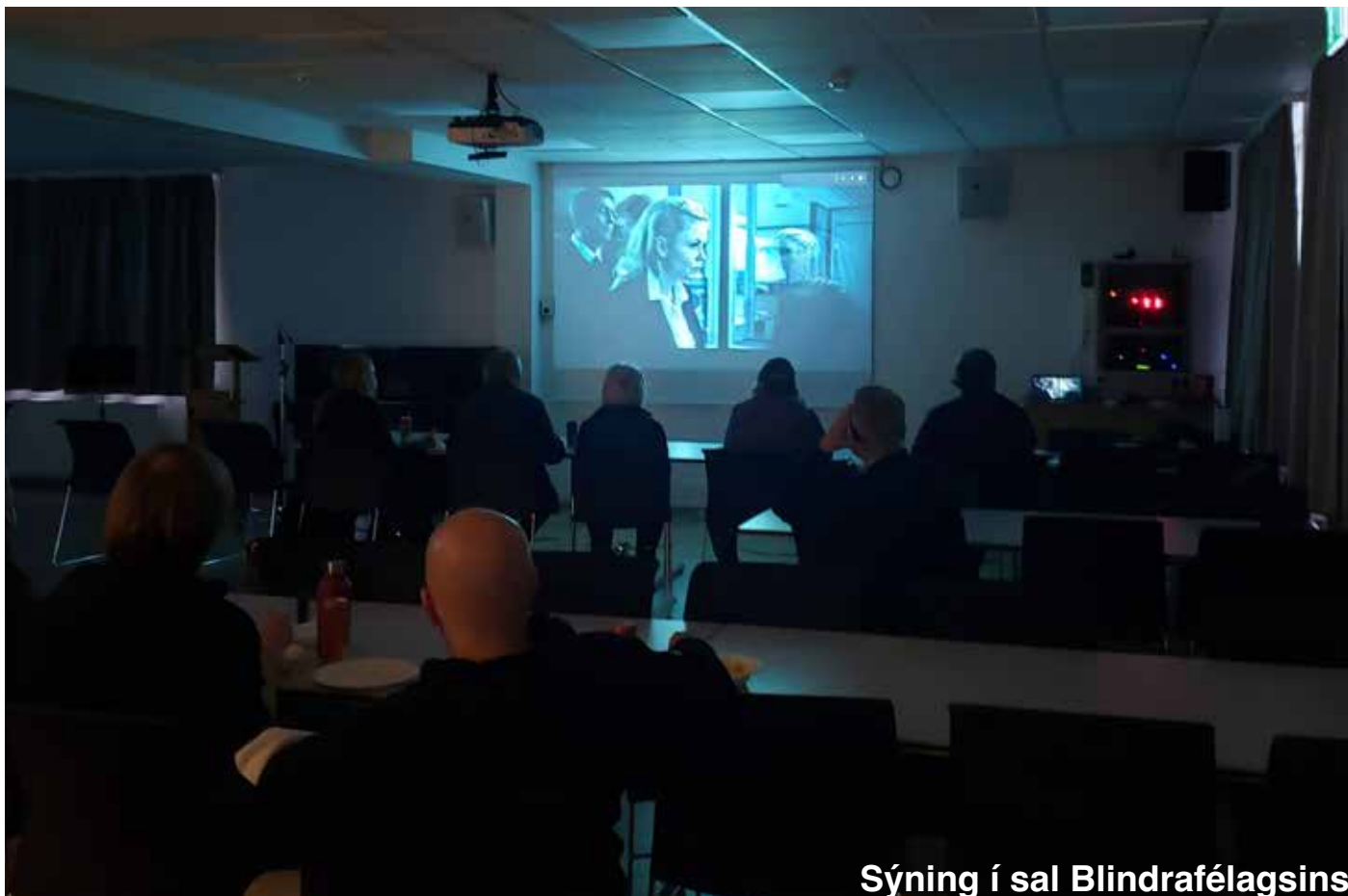
Sýning í sal Blindrafélagsins

gera annað en að sækja smáforritið og velja tungumálið sem sjónlýsingin er á. Smáforritið samstillir sig við myndina sem er í bíó. Þetta er frábær og einföld aðgengislausn.