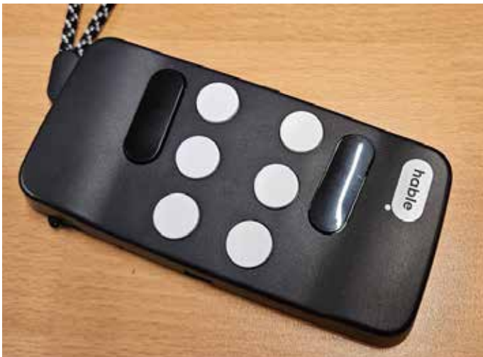
Punktaleturslyklaborðið Hable auðveldar farsímanotkun bls. 24.