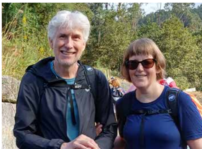
Gönguferð um sveitir Spánar bls. 31.

Víðsjá. Rit Blindrafélagsins, samtaka blindra og sjónskertra á Íslandi. 16. árg. 1. tbl. 2024.