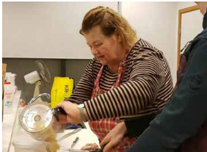
Matreiðslunámskeið Ungblindar bls. 27.