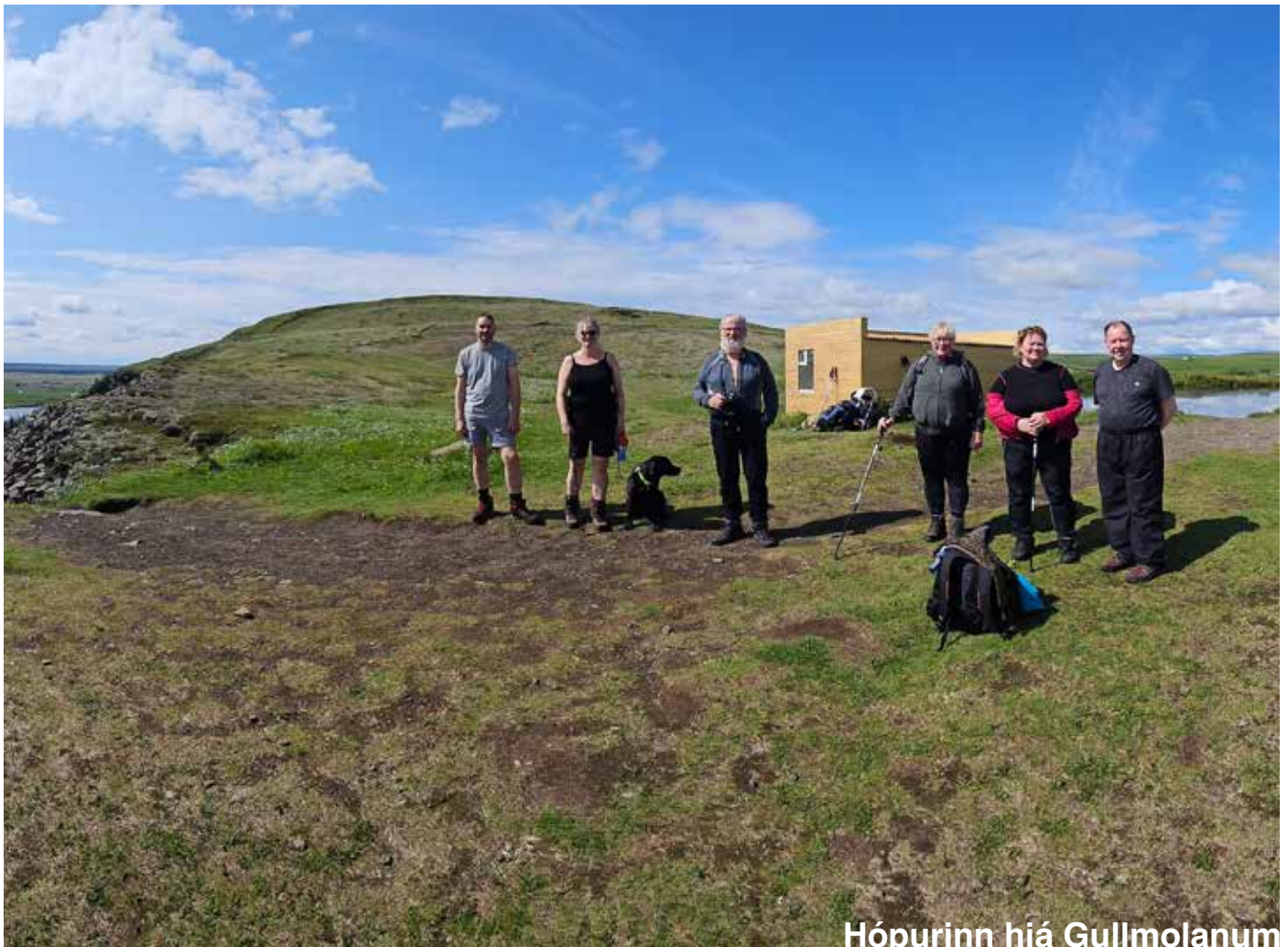
Hópurinn hjá Gullmolanum