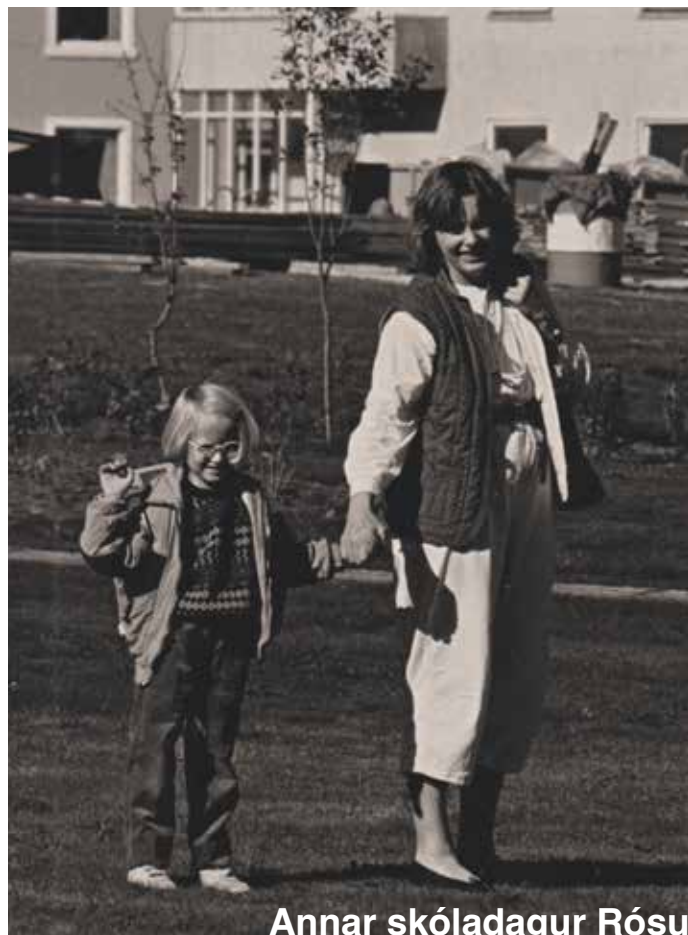
Annar skóladaur Rósu

Ég verð lögblind, sem er oft kallað félagsblind, 25 ára. Þá var ég að læra fornleifafræði og var stödd á Gotlandi að grafa upp víkingaaldarsvæði. Þetta gerðist á nokkrum dögum. Fyrst þurfti ég alltaf að kalla: Hvað er hérna, er þetta eitthvað? Þetta var aldrei neitt. Einu sinni settist ég upp á brúnina á greftruninum og ætlaði að skissa, eitthvað sem fornleifafræðingar gera mikið, og þá sá ég ekki blýantsoddinn lengur. Þá hugsaði ég: „Jæja, þá er þetta komið.“ Þá hafði ég misst